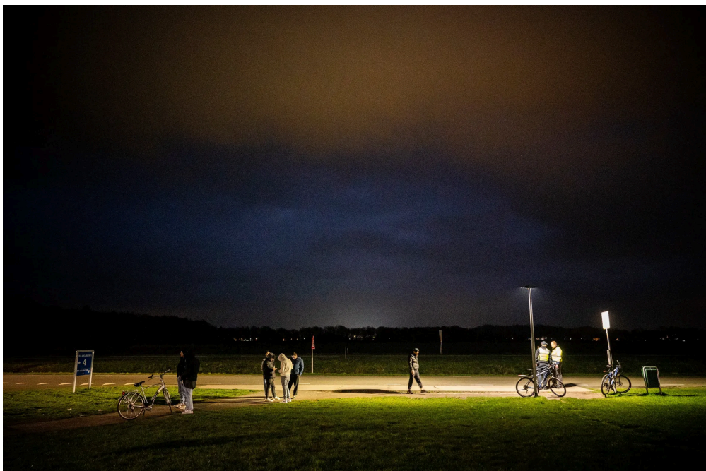
Asielzoekers wachten op de pendelbus bij het aanmeldcentrum in Ter Apel.